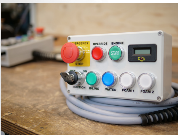
Bedienpanel mit simpler Steuerung

Bei der Schaumfunktion wird durch Luftanreicherung ein trockener Haftschaum erzeugt. Dieser hat ein hohes Volumen und kann als Schaumteppich große Areale bedecken und damit vor Rauchentwicklung und Wiederentzünden schützen.