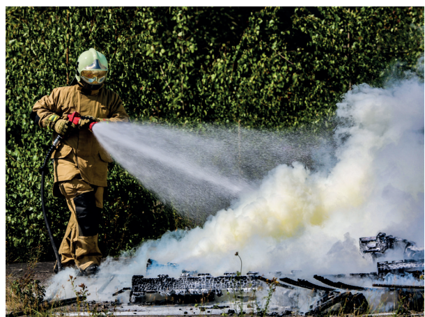
Spraymodus für größere Sprühfläche